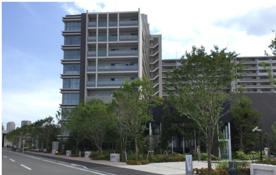
【「プレミスト湘南辻堂」外観】