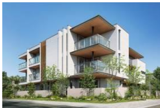
洗練された外観デザイン