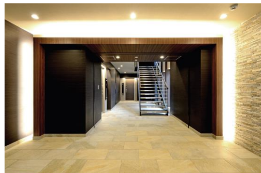
上質な屋内共用空間 イメージ

「GRACA」のエントランスは、オートロックとし、床にはタイルを採用しました。共用廊下や吹き抜け階段を屋内に設けることで、ご入居者を上質な共用空間で迎えるとともに、プライバシーや快適性を確保し、ご入居者の暮らしの満足度を高めます。