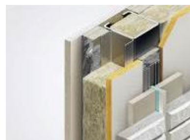
外張り断熱通気外壁