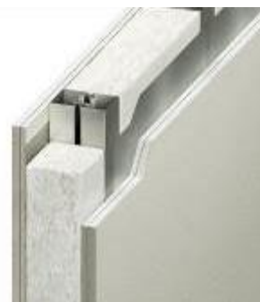
高遮音界壁（エクセレント仕様）