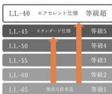
軽量床衝撃音遮断性能