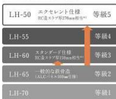
重量床衝撃音遮断性能