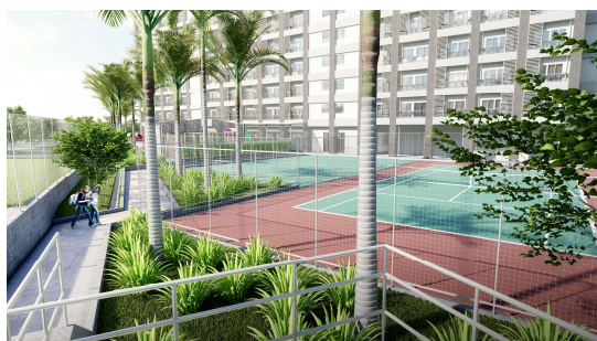
テニスコート・フットサルコート