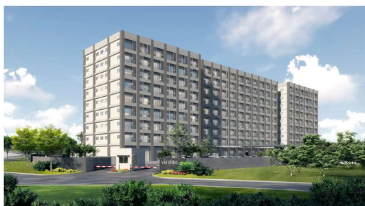
北側からの当施設外観

この事業を通じ、両社が一体となり、インドネシアでJapan Quality(日本品質)の安全・安心の住環境を提供することで、現地に住まう方々の暮らしの更なる質向上に貢献してまいります。