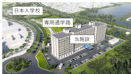
日本人学校への専用通学路