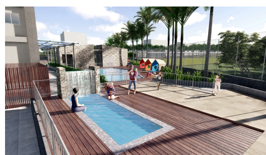
屋外キッズプール