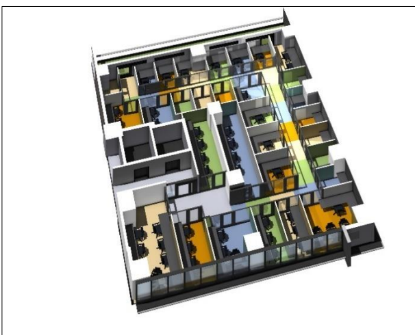
『MID POINT 川崎』執務エリア