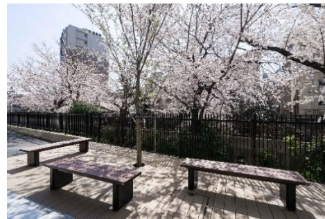
石神井川沿いの桜並木を望むお花見テラス