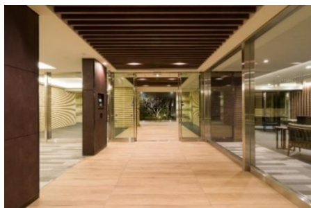
『イニシア板橋 桜レジデンス』風除室