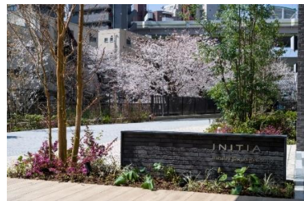
エントランス脇の館銘板

当社は、今後も地域とのつながりを意識した魅力ある街づくり・住まいづくりを通じて“一歩先の価値”を提供してまいります。