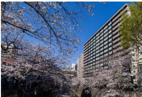
『イニシア板橋 桜レジデンス』外観

大和ハウスグループの株式会社コスモイニシアとあなぶきホームライフ株式会社は、新築分譲マンション『イニシア板橋 桜レジデンス』（東京都板橋区、総戸数152戸）が2021年3月に竣工し、全戸引き渡しをしたことをお知らせします