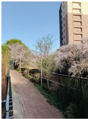
石神井川沿いの河川管理通路