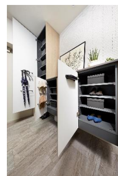
『イニシア板橋 桜レジデンス』モデルルーム写真