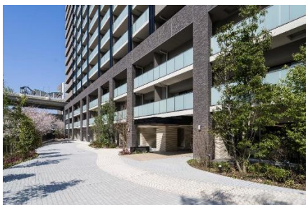
桜並木に面したエントランス前スペース

また、石神井川沿いの河川管理通路（所有者：東京都）を管理する板橋区に働きかけ、協議・承認を経て、当社で桜並木の一部にソメイヨシノの植樹を行うことで桜並木の連続性を生み出すなど、周辺環境と景観の向上に寄与する取り組みを行いました。