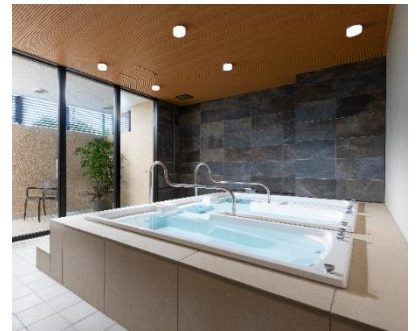
『グランコスモ ザ・リゾート沖縄豊崎』 ゲストルーム (左) / フィットネスルーム (中) / ジャグジー (右)