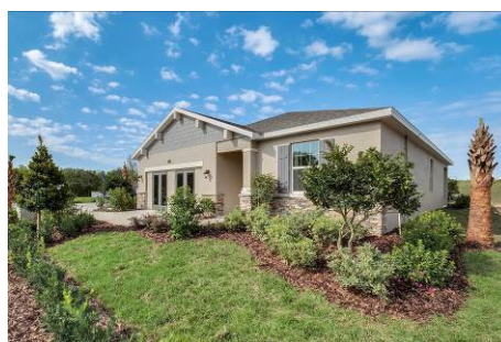
【エイベックス・ホームズ社の戸建住宅商品（例）】