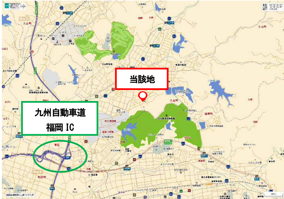
【 現地図 】

「DPL 福岡久山」は、九州自動車道「福岡インターチェンジ」より約3kmと近接しているため、九州各地への輸配送に優れた立地です。また、「福岡空港」、「博多港」まで車で約25分圏内と、陸路輸送だけでなく、空路・海路輸送にも対応可能です。あわせて、福岡市中心部から車で約30分圏内と職住近接の就労環境が整っているため、テナント企業の労働力確保にも有利です。