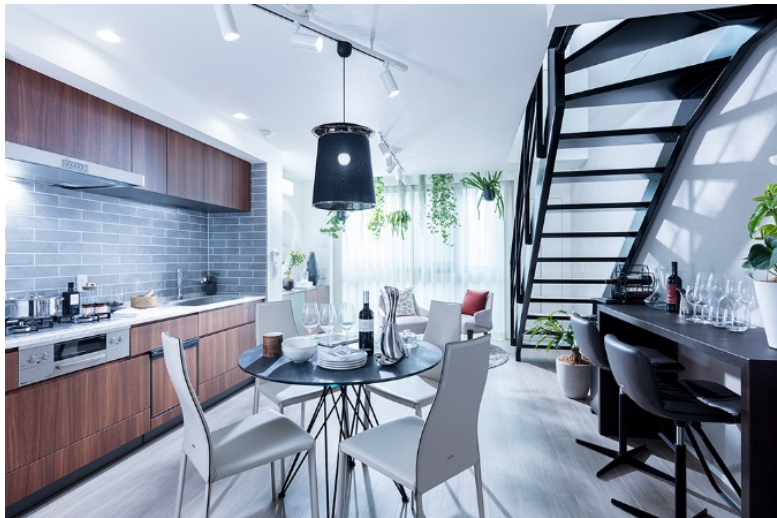
『イニシアテラス目黒学芸大学』type2K モデルルーム

大和ハウスグループの株式会社コスモイニシアは、新築タウンハウス『イニシアテラス目黒学芸大学』（東京都目黒区、総戸数15戸）を2021年11月13日から第1期1次登録受付を開始することをお知らせします。