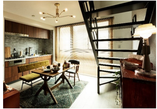
『イニシアテラス目黒学芸大学』 type2N モデルルーム

『イニシアテラス目黒学芸大学』のプランにおける一番の特長は、全邸が上下階の2フロアに分かれたメゾネットタイプであることです。2つのフロアで構成されるメゾネットは、家族が集まる共用フロアと個々の時間を楽しむプライベートフロアといったように戸建住宅感覚でフロアの使い分けができ、立体的な空間構成を活かして変化に富んだレイアウトをつくることも可能です。さらに階段下をオープンスペースにすることで、シェルフで“見せる収納”を作るなど、好みやライフスタイルに合わせた空間づくりを楽しめるように工夫を施しました。