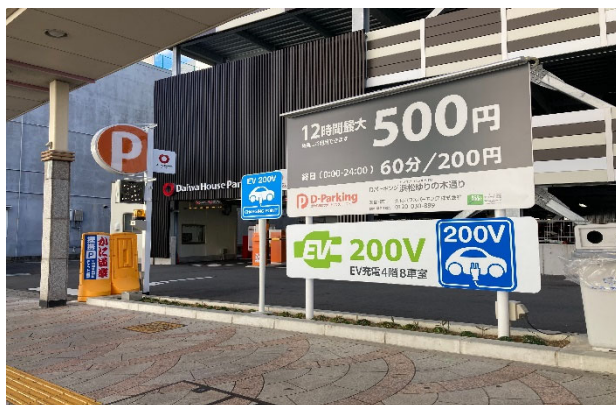
【再生可能エネルギーによる電気自動車充電サービスを 導入する駐車場「D-Parking 浜松ゆりの木通り」】