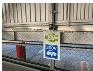
【充電サービス提供場所の標示】

※4. 固定価格買取制度（FIT）対象の再エネ電力の再エネ価値を証書化した非化石証書の中でも、再エネ価値の由来となる再エネ電源が特定されているもの。