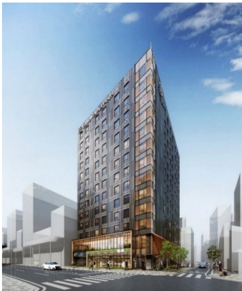
【 「ダイワロイネットホテル熊本銀座通り」外観 】