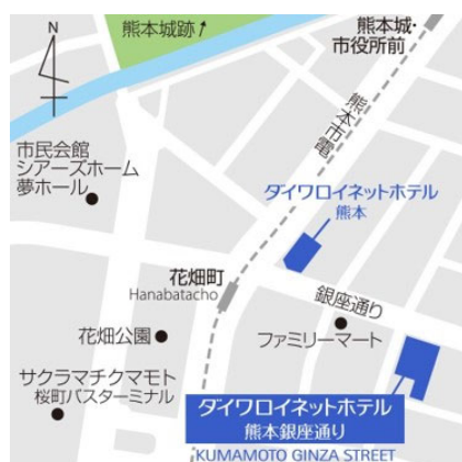
【「ダイワロイネットホテル熊本銀座通り」地図】