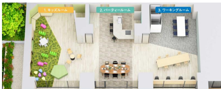
【3つの共有スペース】