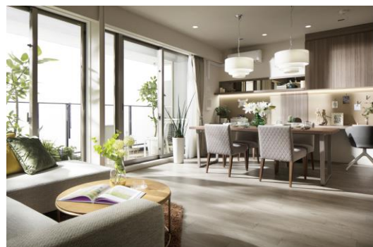
【リビング・ダイニングイメージ】