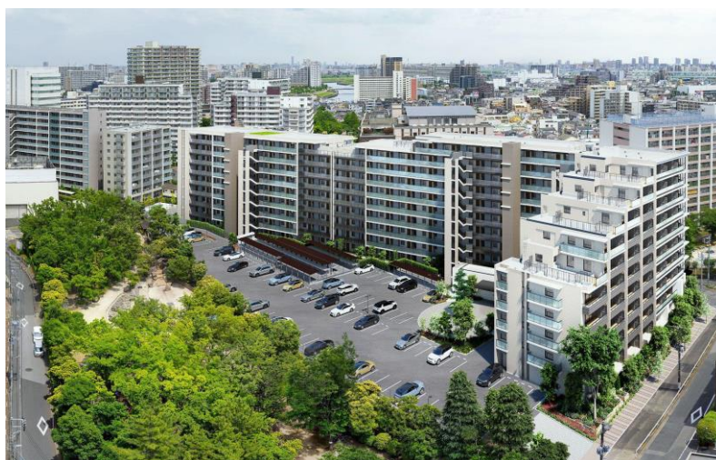
【「プレミスト王子神谷」外観完成予想図】

大和ハウス工業株式会社（本社：大阪市、社長：芳井敬一）は、東京都北区において特許マンション「プレミスト王子神谷」（地上10階建て、総戸数227戸）を建設中ですが、2022年2月19日より第2期販売を開始します。