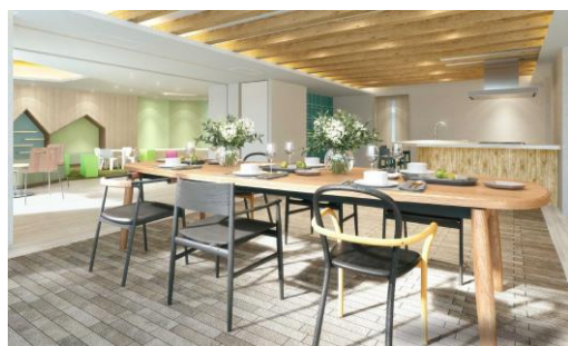
【キッズルーム・パーティールーム】

※1. JBIB(一般社団法人企業と生物多様性イニシアティブ)が開発した、いきもの共生事業所 ® 推進のガイドラインの考え方に沿って計画・管理され、かつ土地利用通信簿で基準点以上を満たし、当審査過程において認証された事業所のこと。