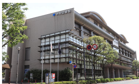
【江戸川区立中央図書館】