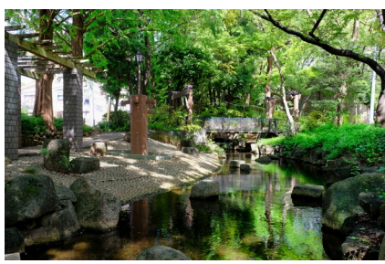
【小松川境川親水公園】