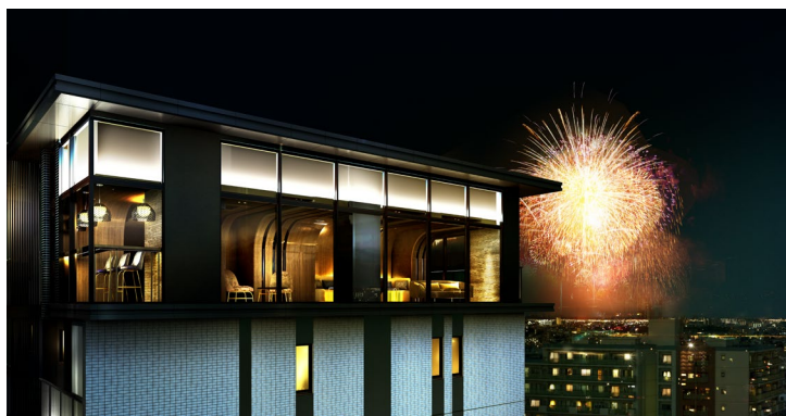
【「プレミスト新小岩ルネ」イメージ】

今回販売する「プレミスト新小岩ルネ」は、東京都江戸川区で豊かに暮らすことを目指した「TOKYO EDENCE ※1 PROJECT」をコンセプトとし、徒歩5分圏内に商業施設や医療施設、教育・子育て支援施設、公園などの生活利便施設が充実した子育てにも適した分譲マンションです。