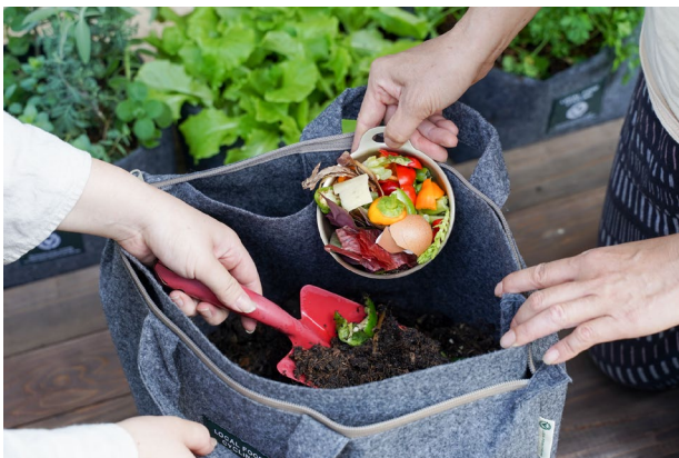
【コンポストセット専用バッグ】

生ごみを捨てる手間や生ごみ臭を解消するとともに、できた堆肥はバルコニーでプランター等による家庭菜園にも活用できます。コンポストをバルコニーに置いて、2カ月生ごみを投入し、3週間熟成させると堆肥が完成。臭いもほぼなく、生ごみを入れて混ぜるだけなので、子どもからお年寄りまでお手軽にできるエコな取り組みです。