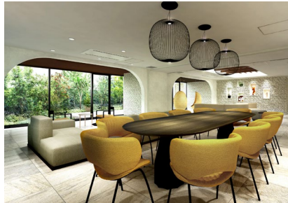
【コミュニティラウンジ】