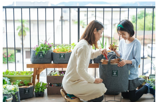
【家庭菜園イメージ】