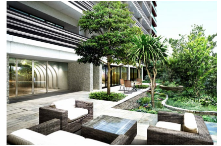
【サンパティオ（中庭）】