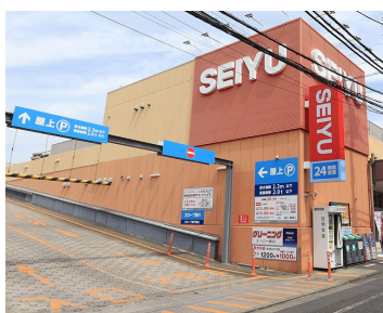
【西友江戸川中央店】