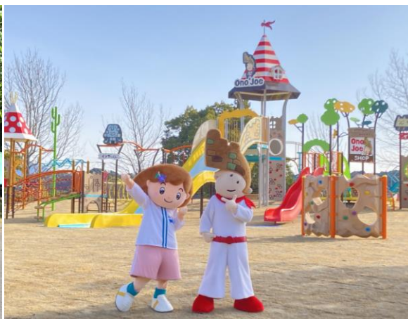
中央公園(キャラクター:まどかちゃん、大野ジョーくん)