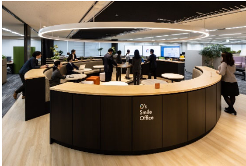
交流の場「ジャンクションスペース」

本執務フロアは、業務内容によって働く場所や時間を自律的に選ぶことができる「ABW」(アクティビティ・ベースド・ワーキング)を取り入れたワークプレイスです。利用者の生産性を最大限に引き出すため、プレゼンテーションや web 会議などができる交流の場「ジャンクションスペース」を中心に多様な執務空間を設け、利用者が笑顔になれる執務フロアとしました。