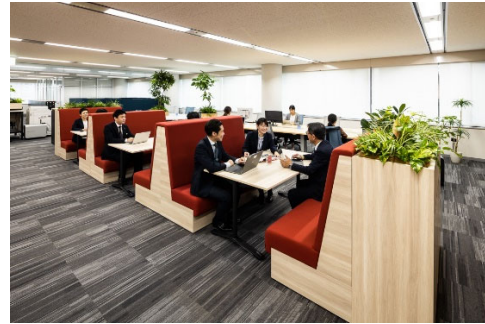
複数の人と打合せする場 「コラボレーションスペース」