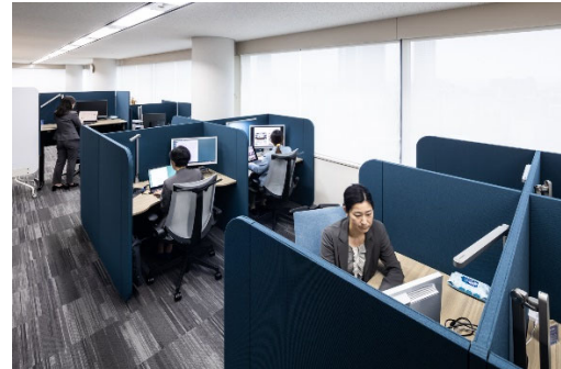
一人で集中する場「ソロワークスペース」