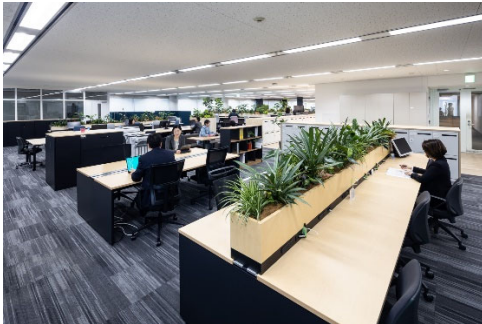
コミュニケーションを取って作業する場 「ワークスペース」