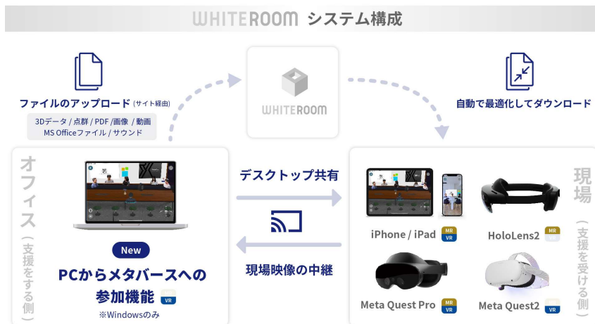
【システムのイメージ】