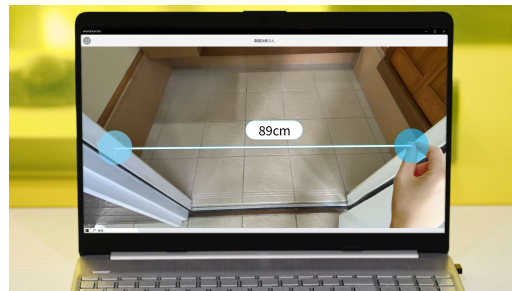
【現場での計測作業を遠隔地のパソコンに中継】