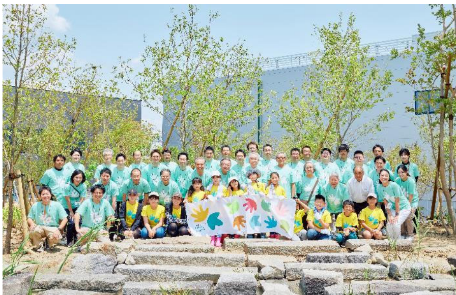
植樹祭参加者との記念写真

本イベントには、児童と一緒に植えた木の成長とともに、「郡山工場」の成長を地域住民にも見守っていただきたいという願いが込められています。