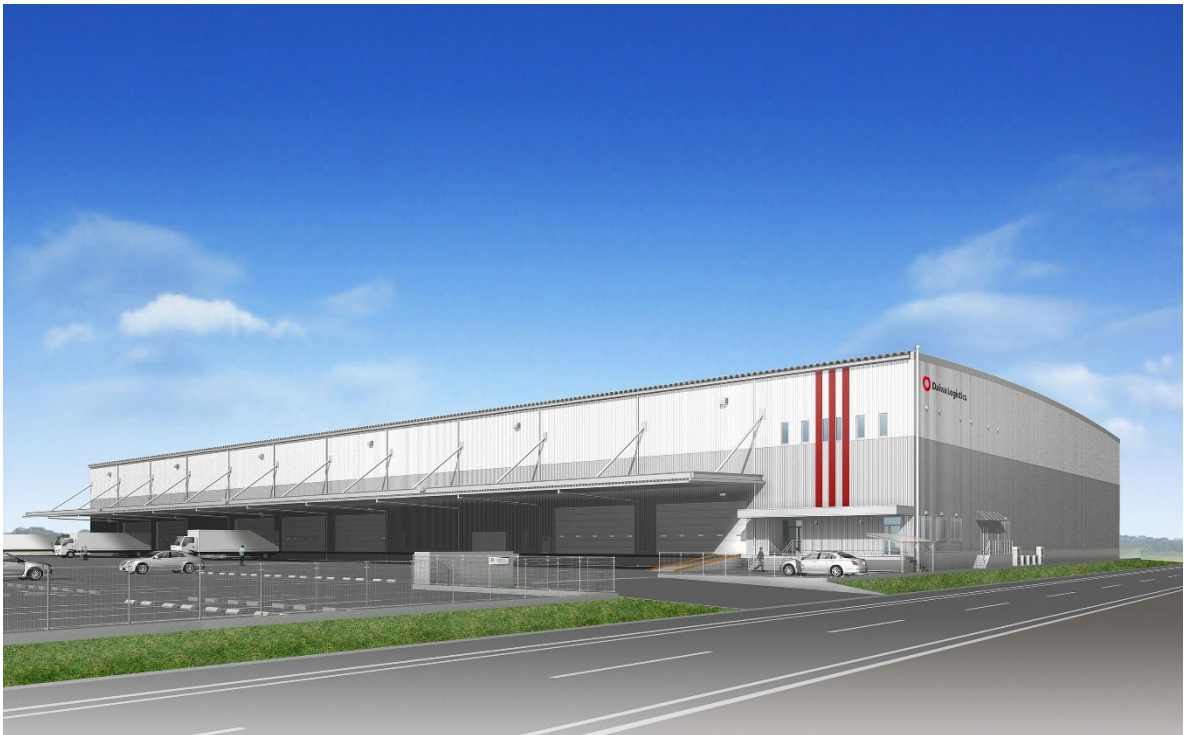
【(仮称) 鹿児島臨空物流センター 完成予想図】

また、本センターの開発決定に伴い、2023年11月14日、霧島市と霧島市鹿児島臨空工業団地における立地協定を締結しましたので、併せてお知らせします。