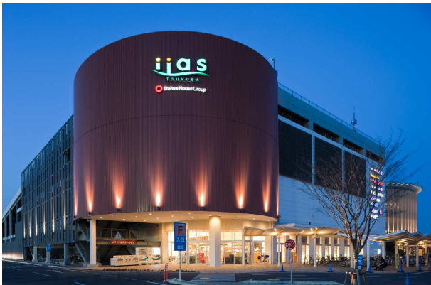
【LED照明にした外部サイン】

大和ハウス工業株式会社（本社：大阪市、社長：大野直竹）が茨城県つくば市で運営する大型複合商業施設「iias（イーアス）つくば」が、環境省主催の「省エネ・照明デザインアワード 2012」の「商業・宿泊施設部門」において優秀事例に選出されました。