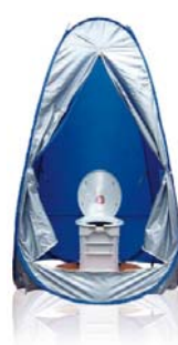
「非常用マンホールトイレ」