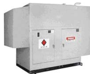
「非常用自家発電機」

あわせて、災害時には炊き出し用のかまどになる「かまどベンチ」を設置します。さらに、マンション1階の防災倉庫には、組み立て式の簡易トイレ「非常用マンホールトイレ」や災害用備品（仮設照明、ヘルメット、毛布、懐中電灯等）を用意します。