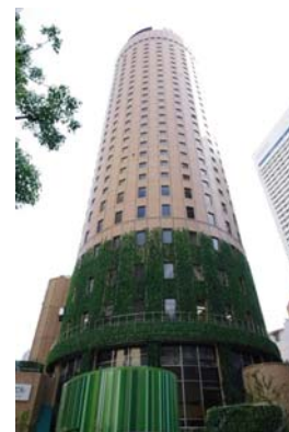
【大阪マルビル「都市の大樹」(大阪府)】

低炭素社会、循環型社会、自然共生社会への対応を成長分野と位置づけ、環境エネルギー事業、住宅ストック事業、リース事業、環境緑化事業など、社会的課題に対応する環境貢献型事業のさらなる成長を図り、同事業の売上高を2012年度1,578億円から1.3倍以上となる2,100億円まで拡大させます。