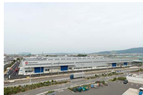
【大和ハウス工業 奈良工場(奈良県)】