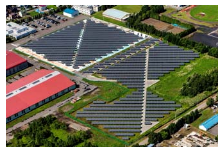
【旧札幌工場跡地太陽光発電所(北海道)】

自社の遊休地、自社施設の屋根等を活用したメガソーラー事業を加速させ、2015年度までに2012年度比6倍以上となる計100MW(メガワット)の再生可能エネルギーによる発電事業に取り組みます。