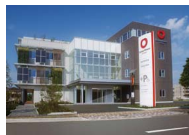
【大和ハウス岐阜ビル(岐阜県)】