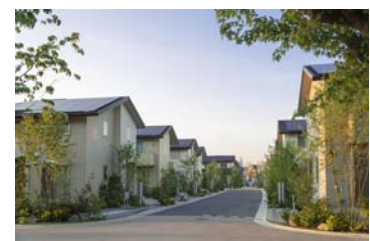
【スマ・エコ タウン晴美台(大阪府)】

また、事業横断、グループ連携による先導的な複合型街づくりを通じて省CO 2 先導プロジェクトの創出を目指します。