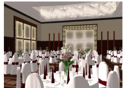
「ロイヤルホール」(イメージ)