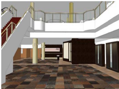
「フロントエントランス」(イメージ)

「フロントエントランス」は、「モダニズム飛鳥」をデザインコンセプトに掲げ、古都奈良に相応しい品格のあるロビーと吉野桜を象徴するフロントにし、「ロイヤルホール」は、「飛鳥京」「藤原京」「万葉集」などの日本の伝統を表現した披露宴会場にしました。あわせて、1階フロント・ロビーフロアもリニューアルします。