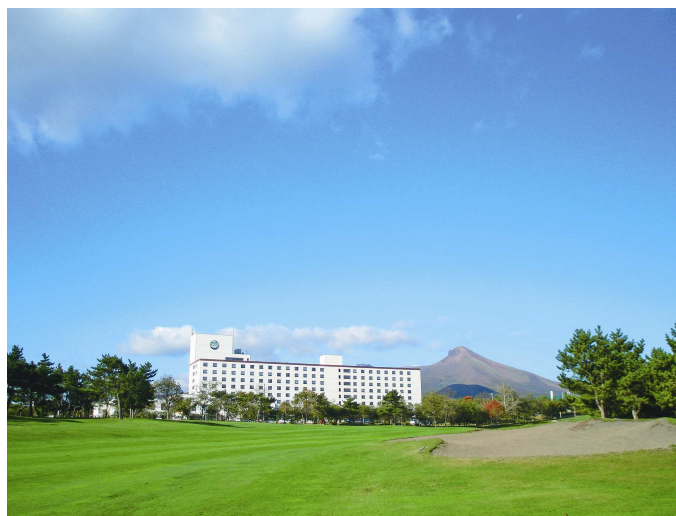
みなみ北海道 鹿部ロイヤルホテル 全景