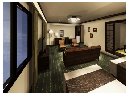
「7階・8階スイートルーム」（イメージ）