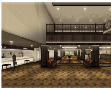
「フロントエントランス」（イメージ）

「みなみ北海道 鹿部ロイヤルホテル」は、大人のための長期滞在型ヒーリングリゾートホテルへと大きく生まれ変わります。