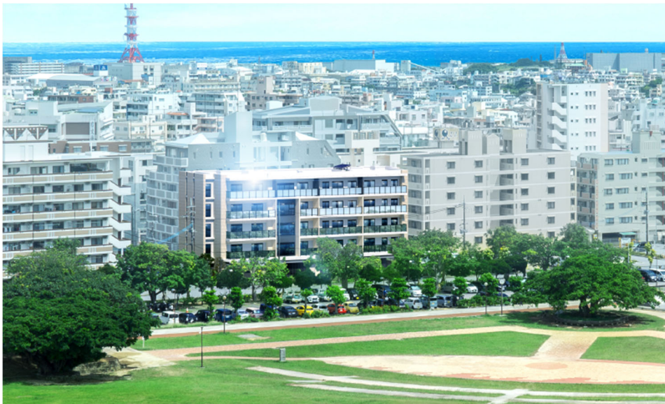
【「プレミスト那覇新都心 ザ・パークフロント」 外観完成予想図】

「プレミスト那覇新都心 ザ・パークフロント」は、新都心公園に隣接しており、大型複合商業施設をはじめ教育・医療・金融など生活利便施設が近接する分譲マンションです。高い断熱性能と省エネ性能をもったZEH-M仕様のマンションとし、全戸が南東向きで、73.50㎡～104.33㎡とゆとりある間取りです。あわせて、全台平面の駐車場は設置率100%を確保しており、大型車・EV車対応スペースも設けています。