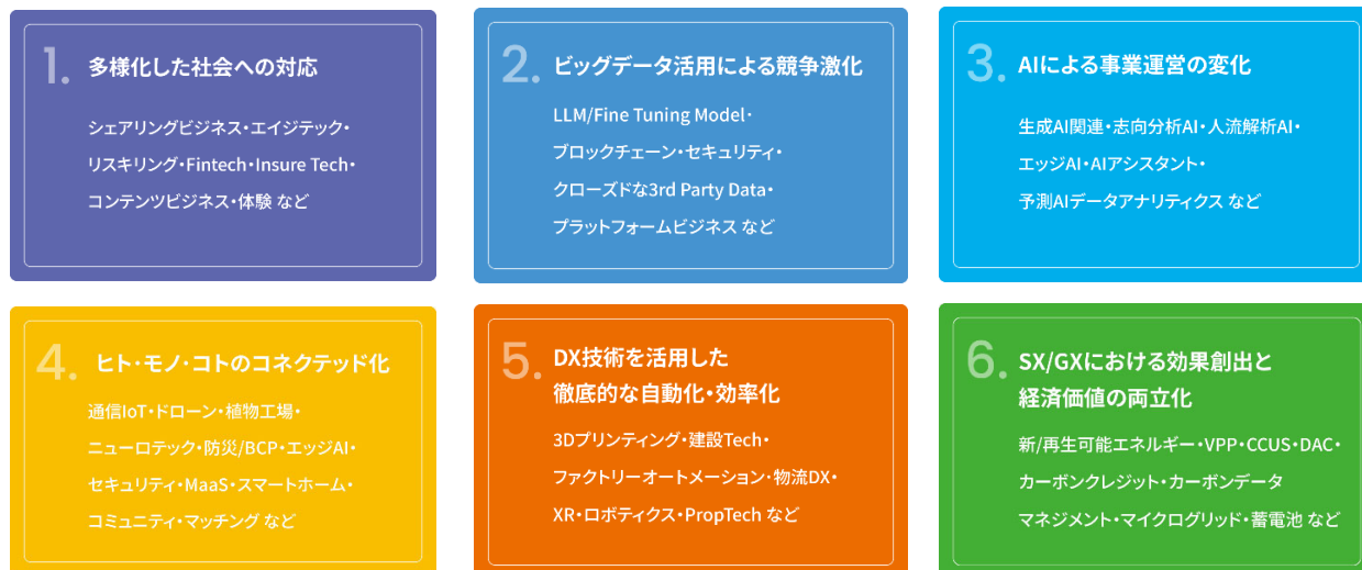
【「大和ハウスグループ“将来の夢”ファンド」の投資領域】

「大和ハウスグループ“将来の夢”ファンド」は、大和ハウスグループが保有する「顧客ネットワーク」や「循環型バリューチェーン」、「幅広いビジネスモデル」とスタートアップの革新技術を掛け合わせることで、イノベーションを目指します。投資領域としては、ビッグデータ活用やDX技術を活用した自動化・効率化など6つの投資領域を設定しました。