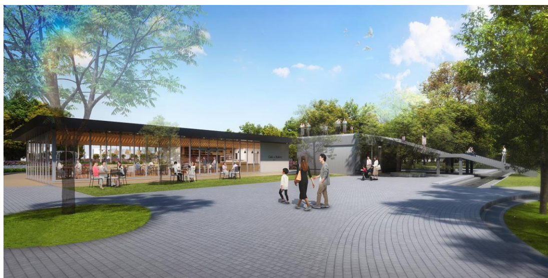
ベーカリーカフェ、パークセンター整備イメージ