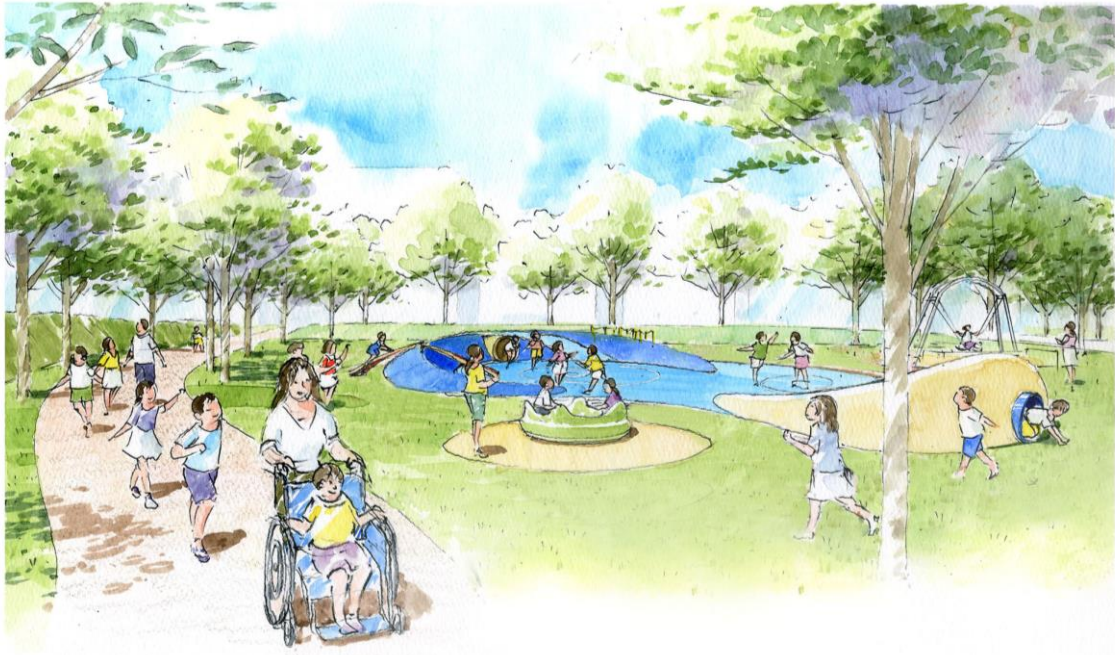
遊具整備イメージ