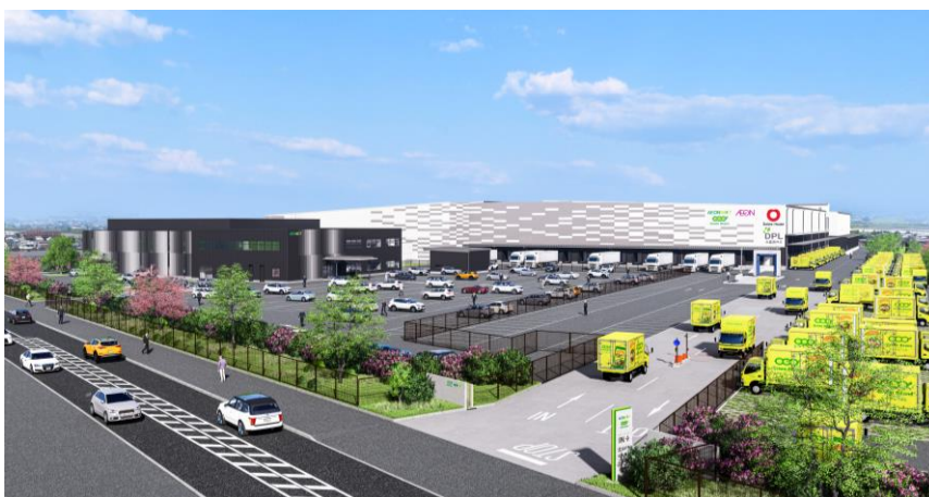
【「DPL 久喜宮代Ⅱ」外観パース】

大和ハウス工業株式会社（本社：大阪市、社長：芳井 敬一）は、2024年9月2日より、埼玉県南埼玉郡宮代町において、3温度帯（常温・冷蔵・冷凍）の設備を導入する物流施設「DPL 久喜宮代Ⅱ」（地上3階建て、敷地面積：87,051.06 m 2 、延床面積：58,517.98 m 2 ）を着工します。