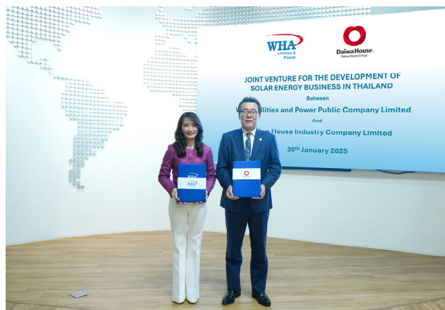
【2025年1月30日の合併契約セレモニーの様子】

※1. 建物所有者から賃借した屋根や同一敷地内に第三者が太陽光発電設備を設置し、発電した電力を当該建物の入居企業に有償供給する仕組みのこと。PPA とは、Power Purchase Agreement の略。