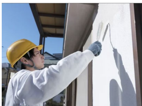
【ハッチュー】現場施工者の派遣イメージ