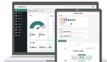
工事現場仕事向けSaaS型業務支援システム