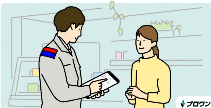
【プロワン】現場での業務を効率化