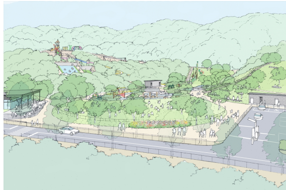
エントランスエリア