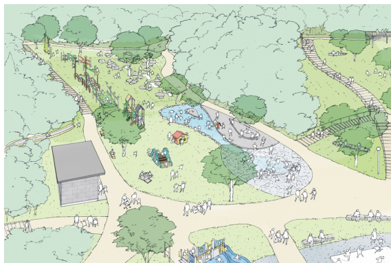
じゃぶじゃぶ池・山登りの路エリア