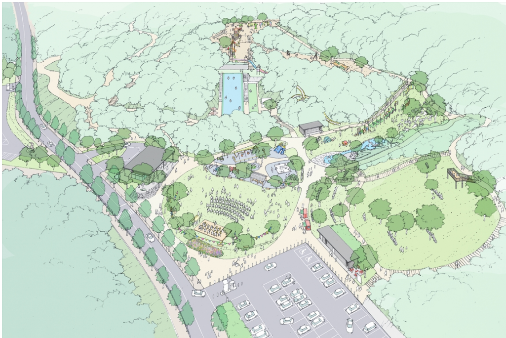
東平尾公園(大谷広場)全景イメージパース ※イメージであり実際とは異なる場合があります。