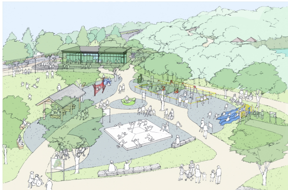
みんなの遊び広場エリア