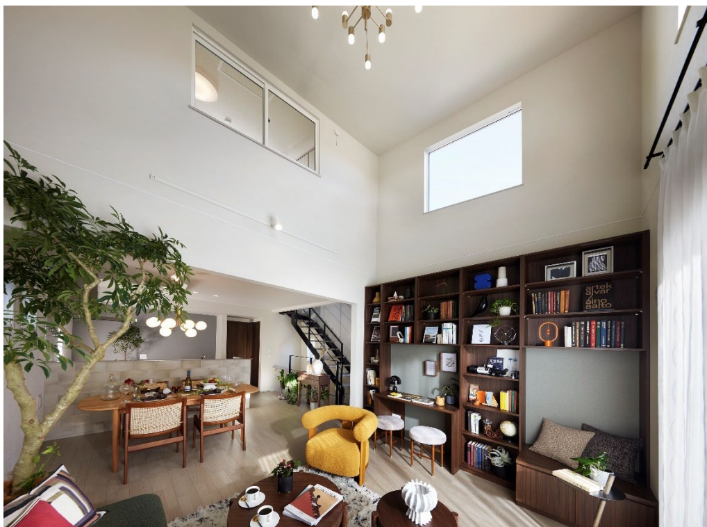
リビング・ダイニング・キッチン（1号棟）

リビング・ダイニングや個室は、独立した空間であると同時に連続した空間でもあります。その動線の中に、しばしそこで過ごしたくなる「場」を創り、住まいへの愛着を深めます。