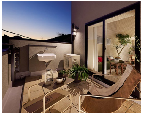
ロフト・ダイニング・洋室3（3号棟）／ルーフバルコニー（1号棟・屋景）／ルーフバルコニー（1号棟・夕景）