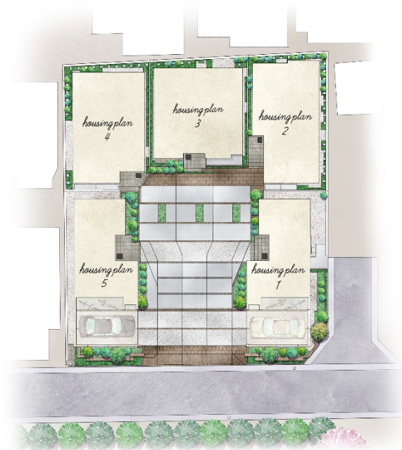
全体区画イメージイラスト

インド砂岩による植栽柵やゲート。斑岩による舗装など、歳月を経ると共に美を深化する風合いに満ちたマテリアルを使用した敷地に、約10.8mの棟間を実現する無電柱化した街区開発を行います。