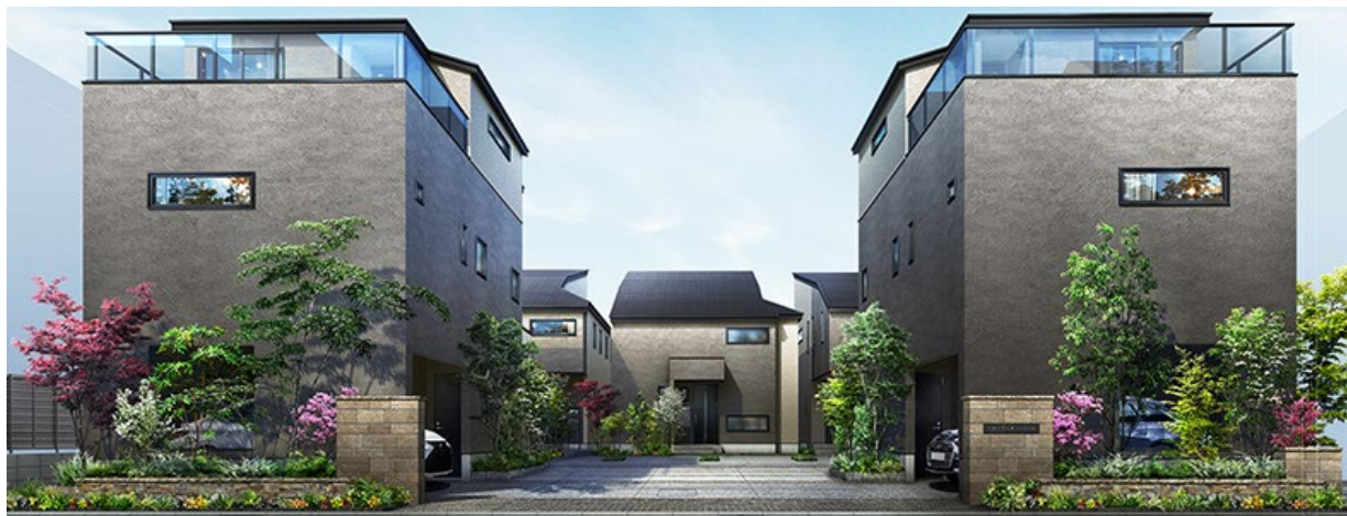
『イニシアフォーラム南荻窪』街並み完成予想CG

大和ハウスグループの株式会社コスモイニシア（本社：東京都港区、社長：高智 亮大朗）は、新築分譲一戸建『イニシアフォーラム南荻窪』（東京都杉並区、総区画数5区画）の第1期3区画（3・4・5号棟）の購入登録受付を2025年3月15日から開始いたしましたのでお知らせいたします。