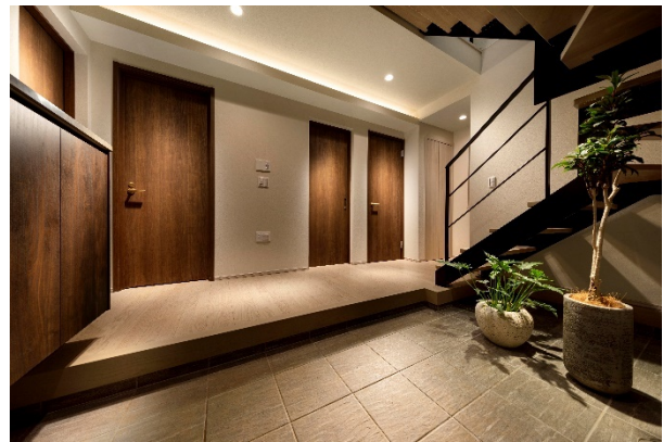
玄関・ホール（3号棟）