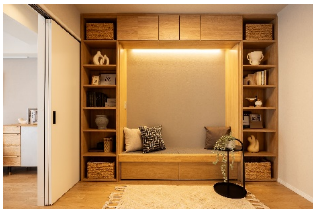
一目でどこに何が収納されているか分かる収納棚