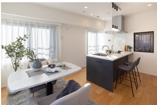
キッチンを空間の中心に配置したオープン設計