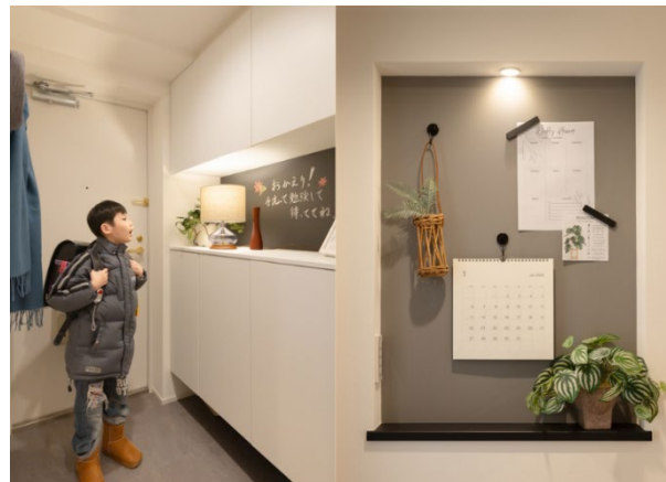
玄関の掲示スペースと黒板クロス