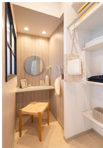
ドレッサー付きウォークイン収納