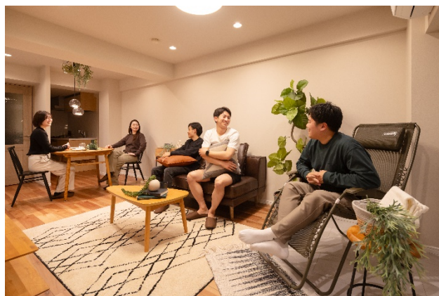
プライベートなコミュニケーション空間