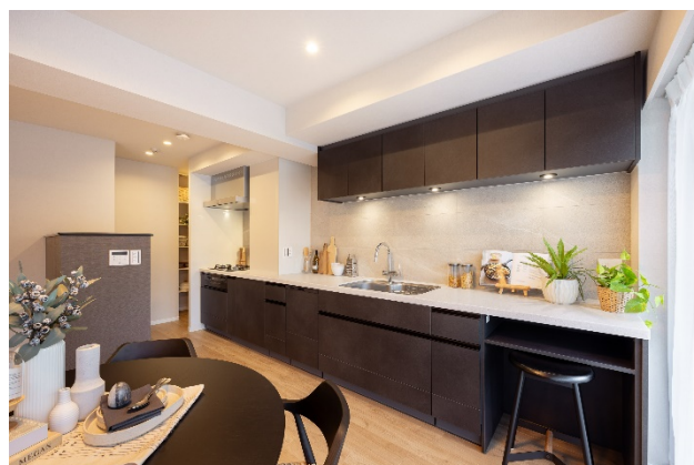
二人で並んでも圧迫感のないキッチン