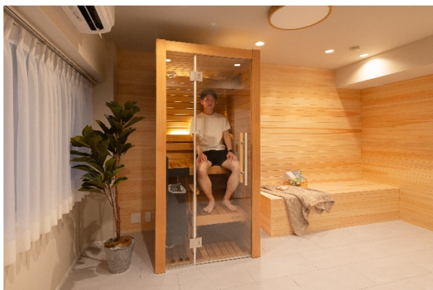
居室内の個室サウナ