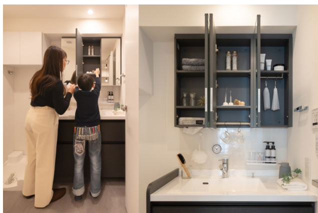
機能性と衛生面に配慮したオリジナル設計の洗面室