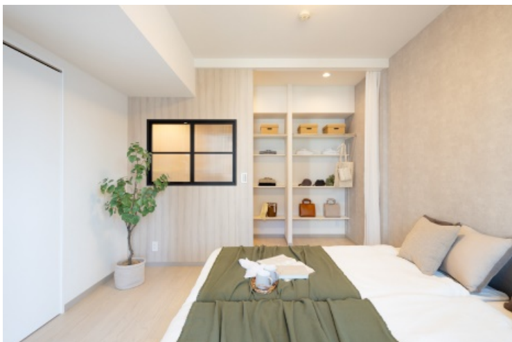
オープンシェルフによる“見せる収納”を配置した寝室