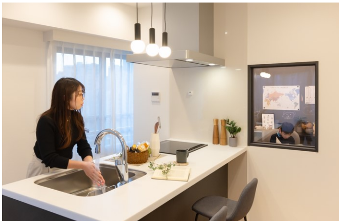
コミュニケーションを育むキッチンと小部屋をつなぐ小窓

また、子どもの成長に合わせて生活空間の距離感を柔軟に調整できるよう、寝室はもちろん小部屋にもベッドが設置できるようにしています。母親が老後を迎えた際に、住まいを「資産」としてそのまま受け継ぐことも、「資金源」として活用することもできるよう、立地のみならず、部屋の仕様や間取りを考慮し、家族の形やライフステージの変化に応じて柔軟に選択できる住まいです。