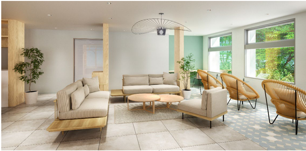
ラウンジ ※完成予想図