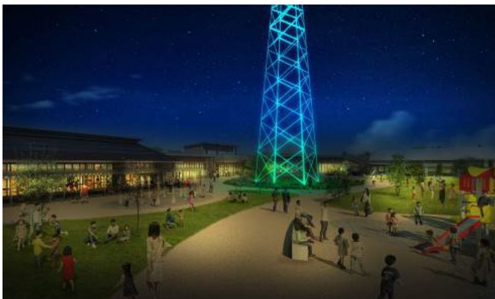
敷地内の鉄塔ライトアップ