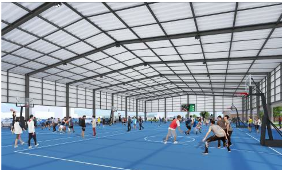
多目的広場(屋根付き)