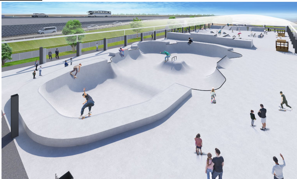
スケートパーク(屋根付き)