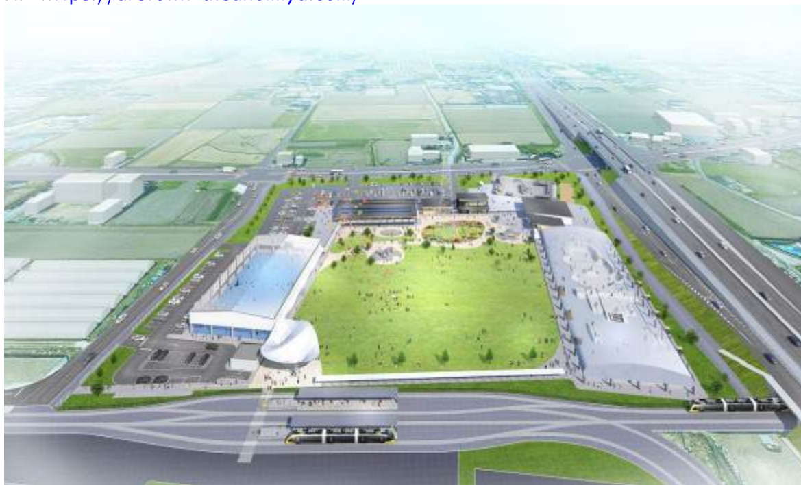
アークタウン宇都宮イメージパース ※イメージであり実際とは異なる場合があります。