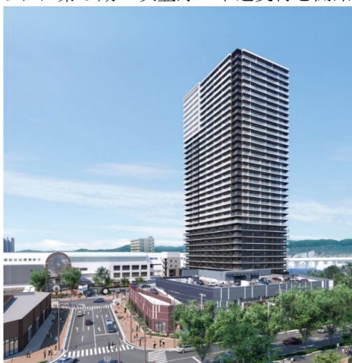
【「久留米ザ・タワー レジデンシャル」(イメージ)】

なお、本物件は2026年3月13日に第3期1次登録の申込受付を開始する予定です。