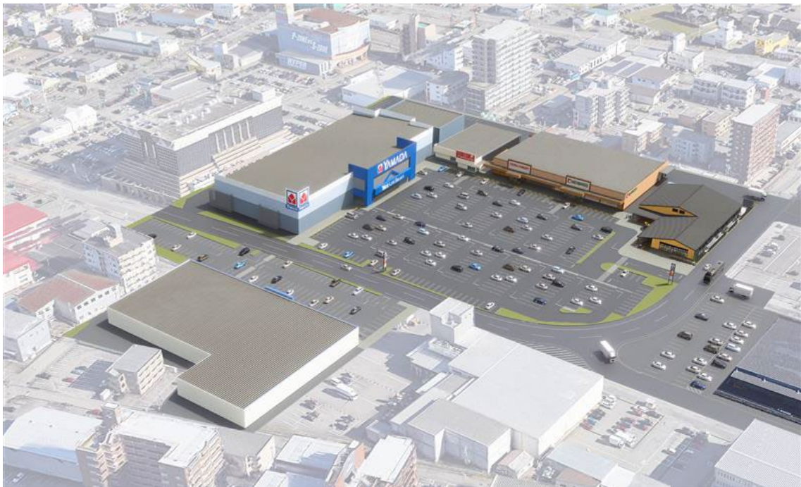
【現在建設中の商業施設と「にぎわい施設」の完成イメージ】