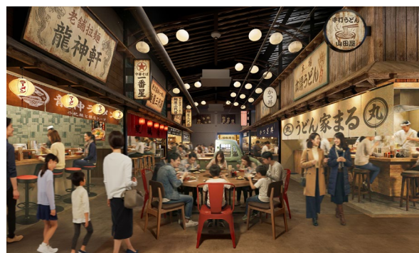
【「にぎわい施設」内観イメージ】