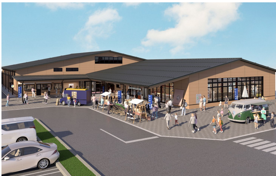
【「にぎわい施設」外観イメージ】

なお、「にぎわい施設」が竣工することで本事業の全ての工事が完了し、2026 年秋には全施設の開業を予定しています。