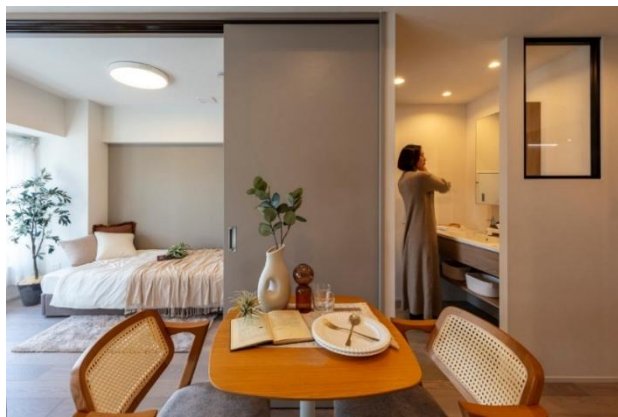
『ストーク武蔵小山』 ダイニング・洋室・洗面化粧台