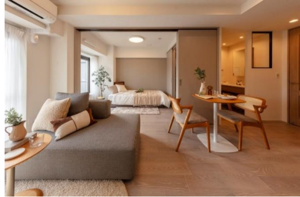
『ストーク武蔵小山』

近年、住宅価格や地価の高騰を背景に、新築住宅を中心に住戸のコンパクト化が進む一方で、住まいに求められる価値は「面積の広さ」から、「どのように使えるか」「どのように感じられるか」へと移りつつあります。既存建物を活用するリノベーションマンションは、新築と比べて比較的ゆとりのある住戸も多いという特性を持ちながらも、当社では広さそのものに依存するのではなく、これまでの間取りや設備配置にとどまらず、住まいを構成する一つひとつの要素の役割を見直すことで、新たな価値創出に取り組んできました。