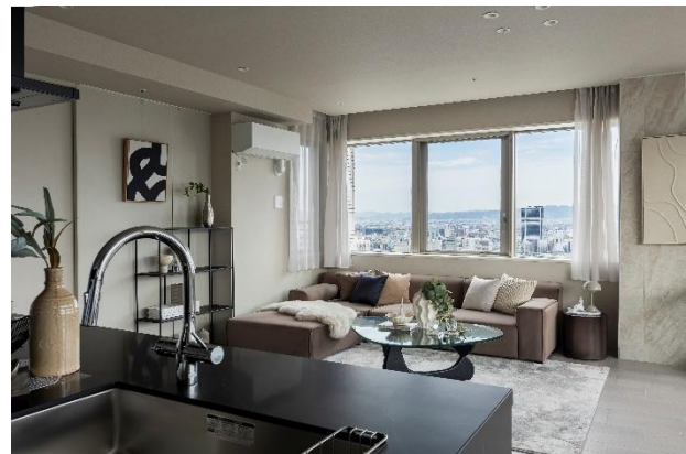
左:キッチン/中央:廊下/右:リビング・ダイニング・キッチン

また、当社は既存住宅の再生・有効活用を図るとともに、環境課題への対策として住宅の省エネルギー化を推進しており、本住戸は「住宅省エネルギー性能証明書(省エネ基準)」を取得しています。