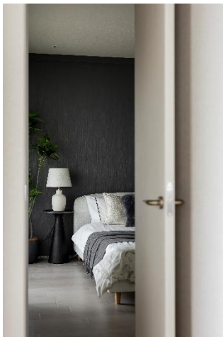
『ローレルタワーサンクタス梅田』洋室