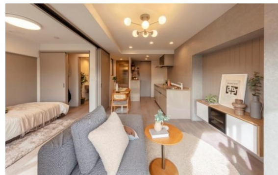
左:洗面化粧台/中央:ウォークインクロゼット/右:リビング・ダイニング・キッチン・洋室