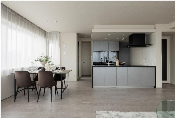
『ローレルタワーサンクタス梅田』

※1 スパパ=スペースパフォーマンス:空間対効果、空間の利用効率を良くする暮らし方・過ごし方のこと