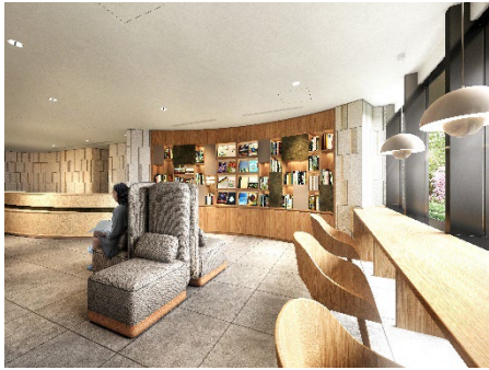
【「ライブラリーサロン」完成予想図】