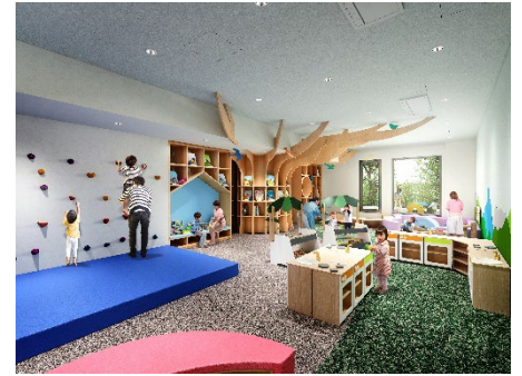
【「アソベース」完成予想図】