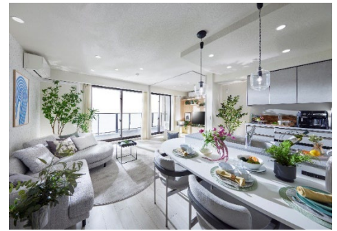
【モデルルーム (OK タイプ)】

また、食器洗い乾燥機やディスポーザー、リビング・ダイニングに床暖房を標準装備したほか、全タイプにウォークインクローゼットを設置するなど、住みやすさと快適さを両立させました。