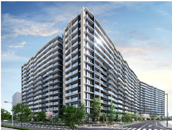
【「プレミストつくば研究学園」外観完成予想図】

大和ハウス工業株式会社（本社：大阪市、社長：大友浩嗣）は、旭化成ホームズ株式会社と共同で、茨城県つくば市において、分譲マンション「プレミストつくば研究学園」（地上 15 階建て、総戸数 602 戸）を建設中ですが、2026 年 5 月 15 日より販売を開始します。