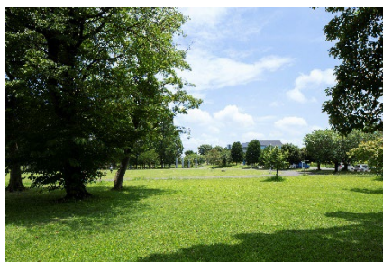
【「研究学園駅前公園」】