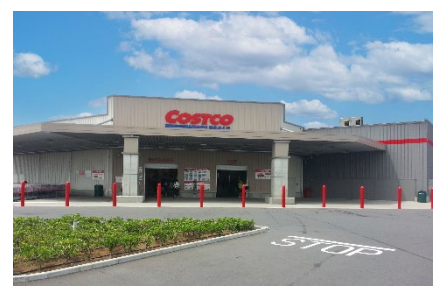
【「コストコホールセール つくば倉庫店」】