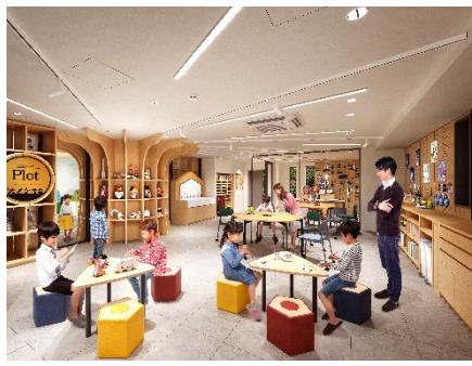
【「ケンキュウラボ」完成予想図】