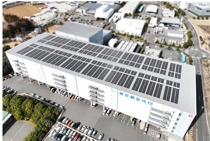
【東京納品代行 成田 FLC I】

※2. オフサイト PPA: 発電事業者が需要家の施設の「敷地外」に発電設備を設置し、そこで発電した電気を需要家が購入する仕組み。