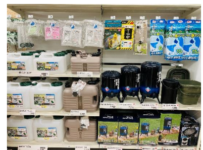
災害時にも役立つ「アウトドア用品」