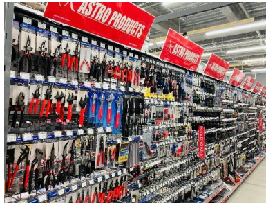
「アストロプロダクツ」の自動車整備用品