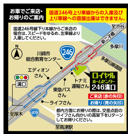
「ロイヤルプロ246溝口」(案内図)