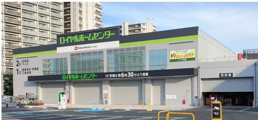
【 ロイヤルホームセンター246溝口 】

当店のオープンにより当社ホームセンターは全国で67店舗目、神奈川県内で14店舗目となります。