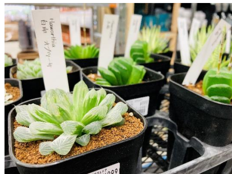
種類豊富な多肉植物