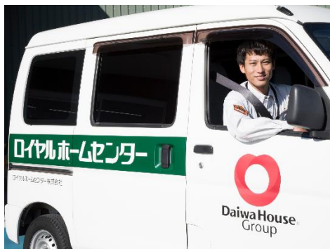
当社従業員が行う取り付け・交換代行サービス「ロイサポート」

※6. 各種専門の資格を有する当社従業員が見積もりから施工まで行うサービスです。