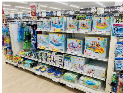
季節を楽しめる「レジャー用品」