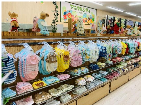
豊富に取り揃えた「ペット用品」

また、ガーデニング関連商品では、オリーブや多肉植物などの定番から、ユーカリなどのオーグープランツ類、アロイド系（サトイモ科）の観葉植物など、個性的でインテリア性の高い樹木や観葉植物を厳選。植栽用の鉢や装飾品などの園芸用品を含めた約 3,200 アイテムの品揃えで「自分好みにコーディネートできる楽しみ」を提供します。