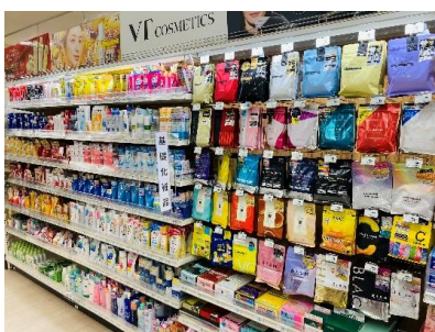
「ビューティ・コスメ関連」を強化

また、「しっかり品質を納得価格」で提供する当社プライベートブランド「iEMOE（イエモア）」の商品とあわせ、日常生活から災害対策まで備えをサポートする売場でお客さまをお迎えします。