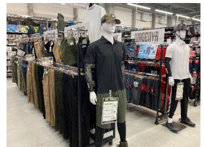
プライベートブランドの「和玄屋」