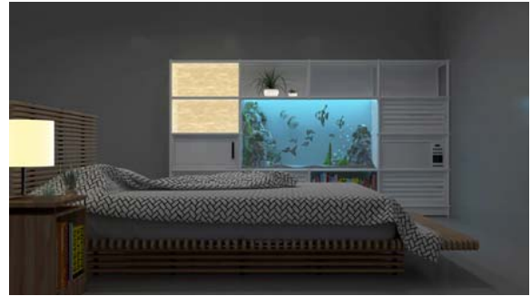
リラックスに寄り添うベッドルーム