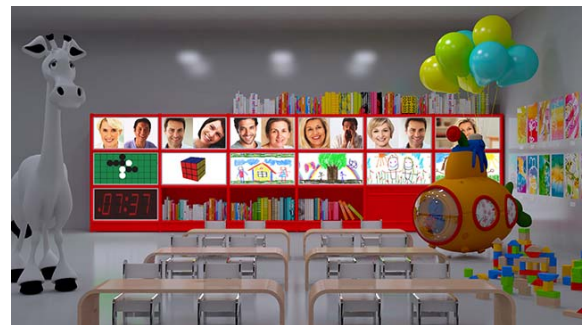
イマジネーションを具現化する学校