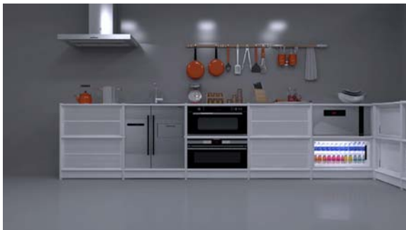
どこにでも設置できるキッチン