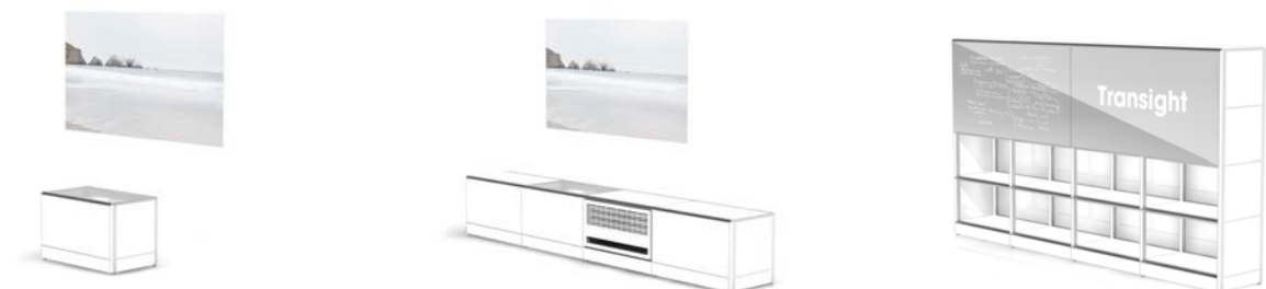
「Transight」構成ユニットイメージ

「Transight」をオープンプラットフォームとした他業種との協業を展開することで、家電やインテリアなどのハードと、ネットワークやコンテンツなどのソフトが融合された、新たなビジネスモデルを構築します。