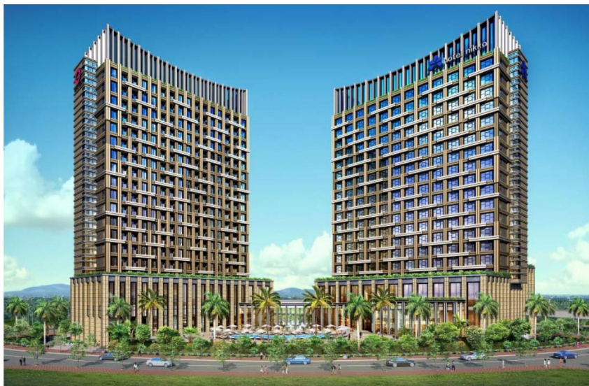
【完成イメージ図（左：ロングステイホテル 右：ホテル）】

※1. 中長期滞在を目的としたお客様をメインターゲットとしたより利便性の良い宿泊施設。