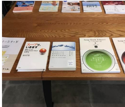
ご家族で楽しんでいただけるマンションギャラリーをご用意