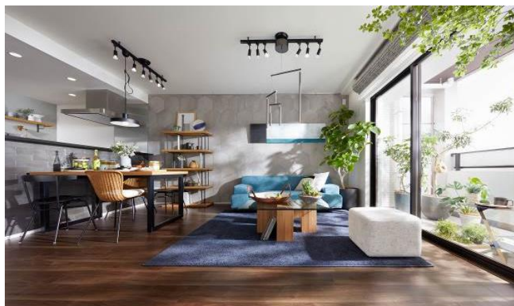
『イニシア志木』モデルルーム

開放感あふれる二方道路の敷地に、南東(43戸中34戸)向きと南西(43戸中9戸)向きの住戸を配置。角住戸を豊富に確保する二棟構成にしています。