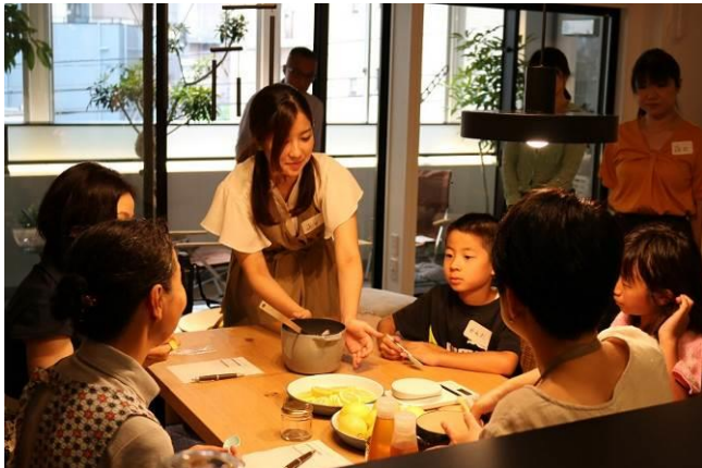
「レモンシロップ」のつくり方ワークショップ (2017年7月実施)の様子

マンションギャラリー接客コーナー内には関連書籍等をご用意。ご家族で楽しんでいただける空間でご案内しています。