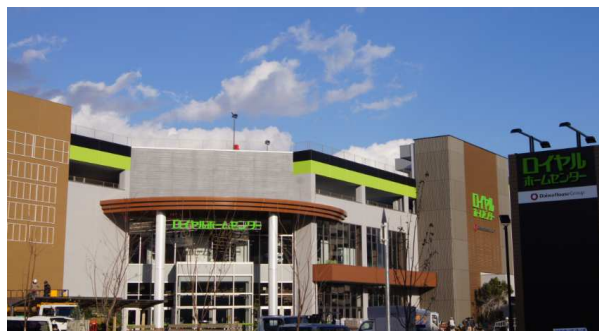
「ロイヤルホームセンター西宮中央」