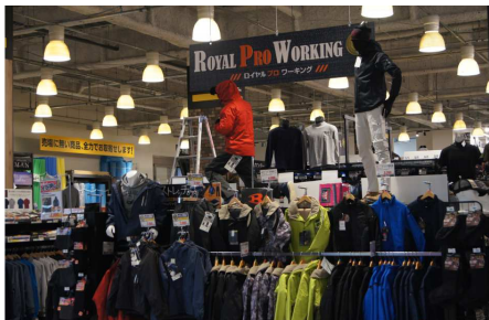
「ロイヤルプロワーキング」