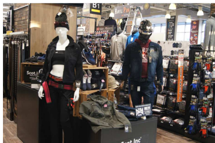
「女性向けの作業着」