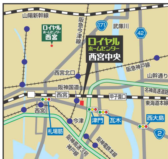
ロイヤルホームセンター西宮中央 (案内図)