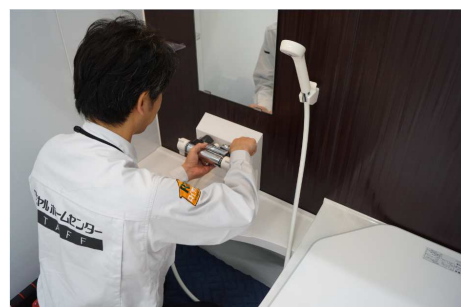
【取り付け・交換代行サービス】