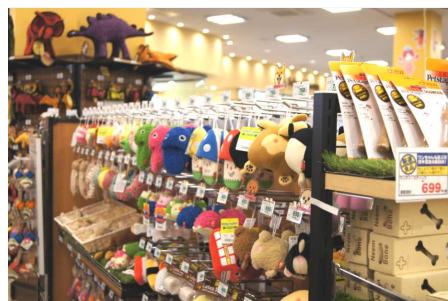
「おもちゃコーナー」