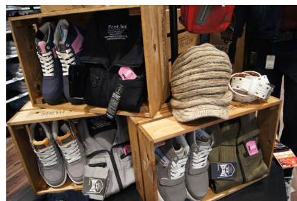
「女性用のセーフティーシューズ」