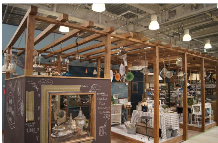
「インテリアブース」