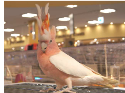
「珍しい動物(クルマサカオウム)」