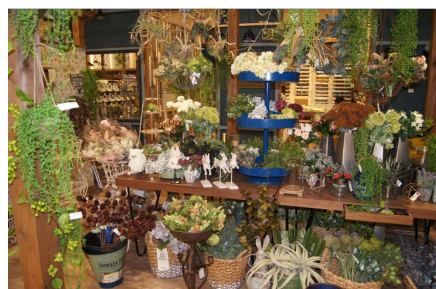
「インドアガーデニング」