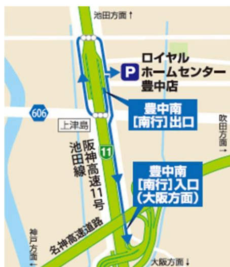
[南行]ご利用時の経路