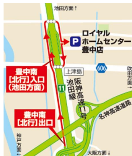
[北行]ご利用時の経路