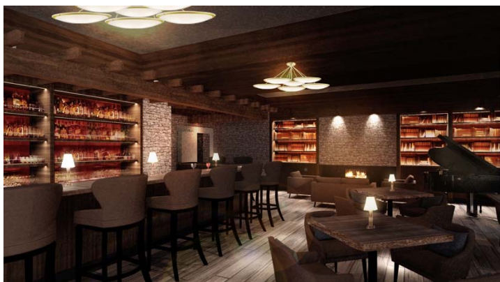
併設の「Café & Bar 15」は暖炉のある落ち着いた空間