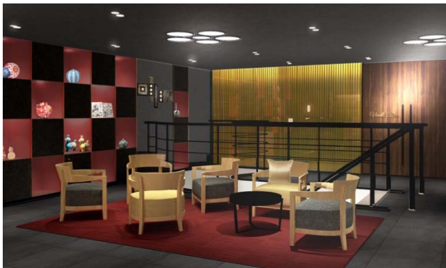
金沢らしさを演出したロビー