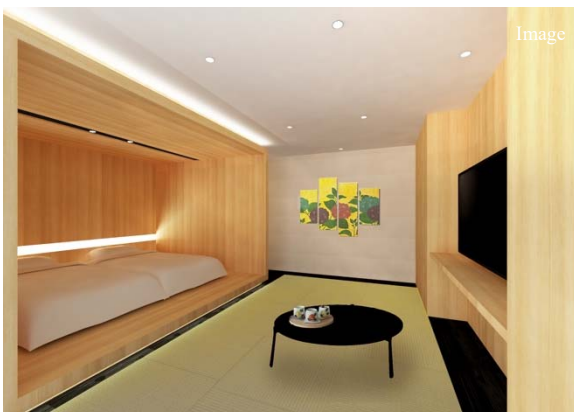
ツインのローベッドを備えたプレミアムクラス

併設された直営の飲食施設「Café & Bar 15」では暖炉やグランドピアノを備えた重厚感のある空間で朝食から夜のバーまでお楽しみいただけます。宿泊利用者だけでなく、近隣のビジネスマンや地元の方など、どなたでも気軽にご利用いただける、地域に根ざした施設を目指します。