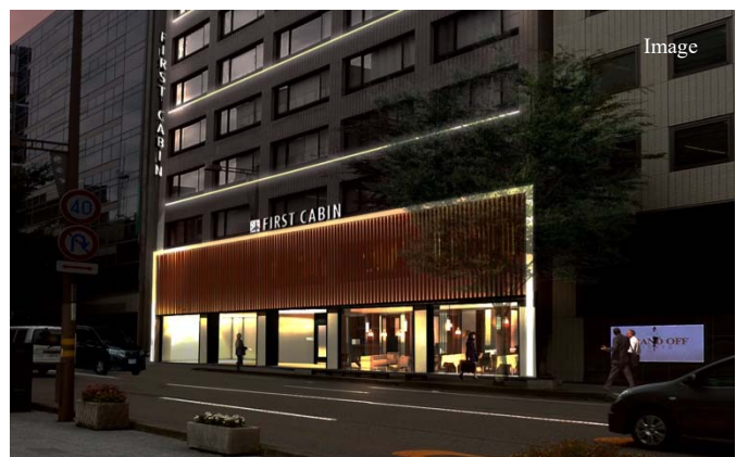
元金融機関であった重厚感のある建物を有効活用