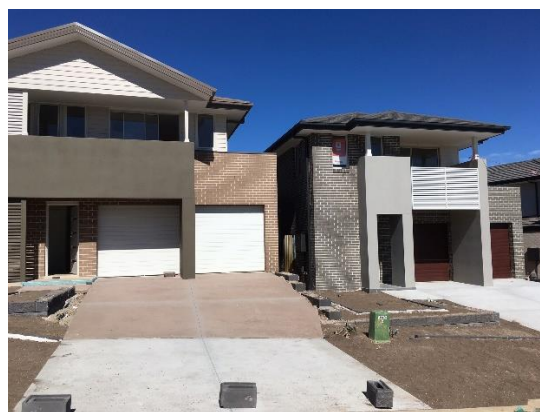
【Thrive Home (スライブホーム)】