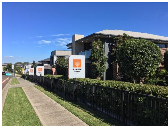
【Rawson Homes (ローソンホームズ)】

今回ローソングループは、大規模住宅地「(仮称) ボックス・ヒル・プロジェクト」において、戸建住宅を建設・販売する計画です。買い替え層向けの住宅ブランド「Rawson Homes (ローソンホームズ)」、一次取得者向けの住宅ブランド「Thrive Home (スライブホーム)」を販売します。