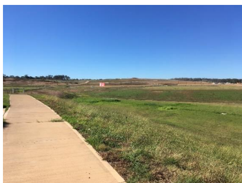
【現在の「ボックス・ヒル」エリアのようす】