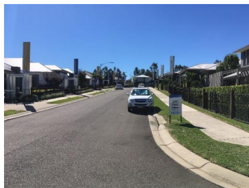
【将来の「ボックス・ヒル」（近隣の分譲地のようす）】