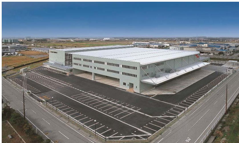
【若松梱包運輸倉庫の4温度帯共同配送物流基地】

※3. 医薬品の適正流通基準のこと。医薬品の製造管理と品質管理の基準を補完するものとして、流通過程の保管や輸送まで拡大しています。