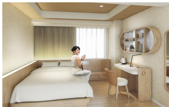
【レディーススタンダード】

※3. デラックスツインルーム・コネクティングルームは女性専用フロア以外にもございます。