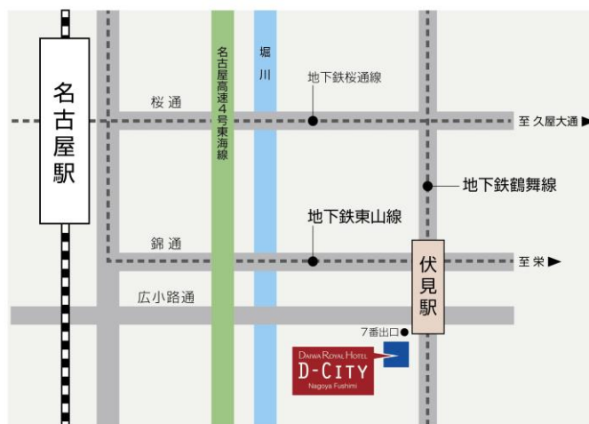
市営地下鉄 東山線・鶴舞線「伏見」駅7番出口より徒歩約1分