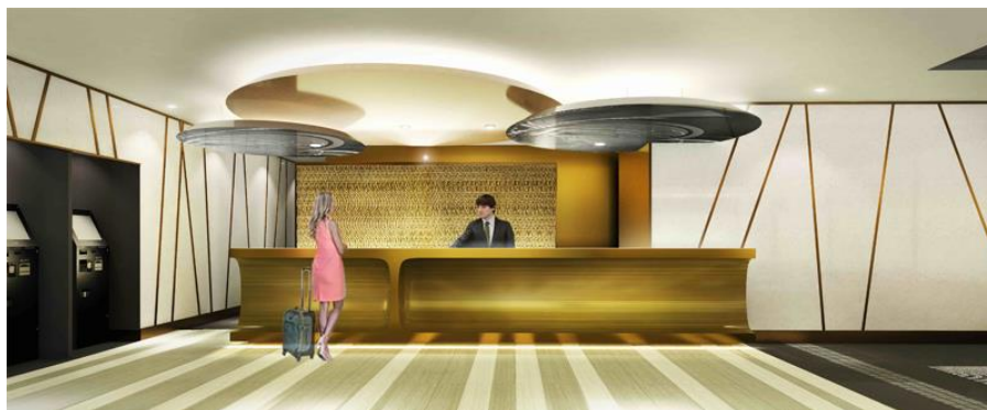
【フロントカウンター】