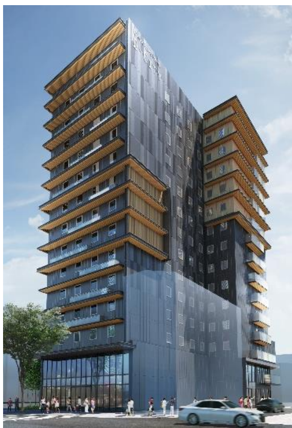
【「ダイワロイヤルホテル D-CITY 名古屋伏見」外観パース】