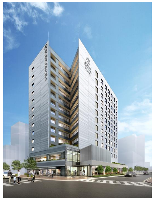
【ダイワロイネットホテル富山駅前】