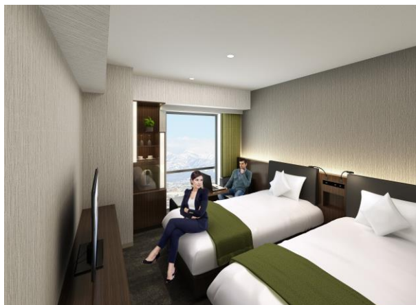
【客室・パリューツイン】